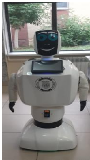
Сурет 2. Робот — Ғалымбек