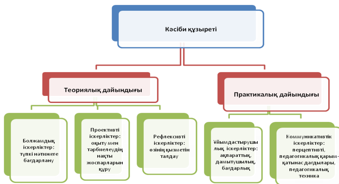
Сурет 2. Бастауыш сынып мұғалімдерінің кәсіби құзыретінің құрылымы

Педагогтің кәсіби құзыреті мәселесінің теориялық тәсілдері мен эмпирикалық зерттеулер деректерін талдау бастауыш сынып мұғалімдерінің кәсіби құзыретінің құрылымын жасауға мүмкіндік берді (2-сурет).